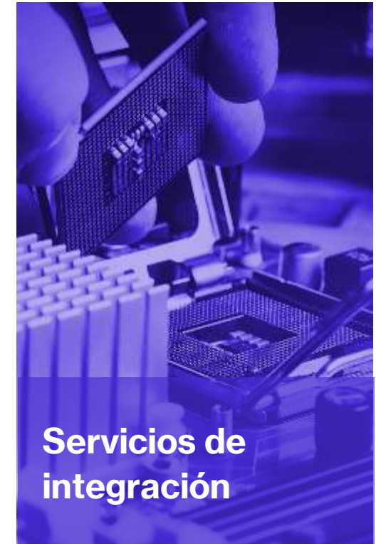
Servicios de integración