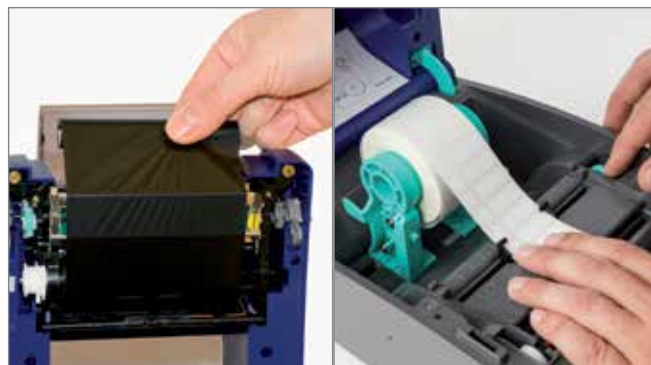
Paso 1: Introduzca el soporte