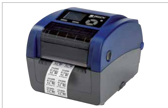
Paso 3: Imprima